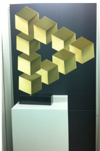
Penrose doré par TABARY